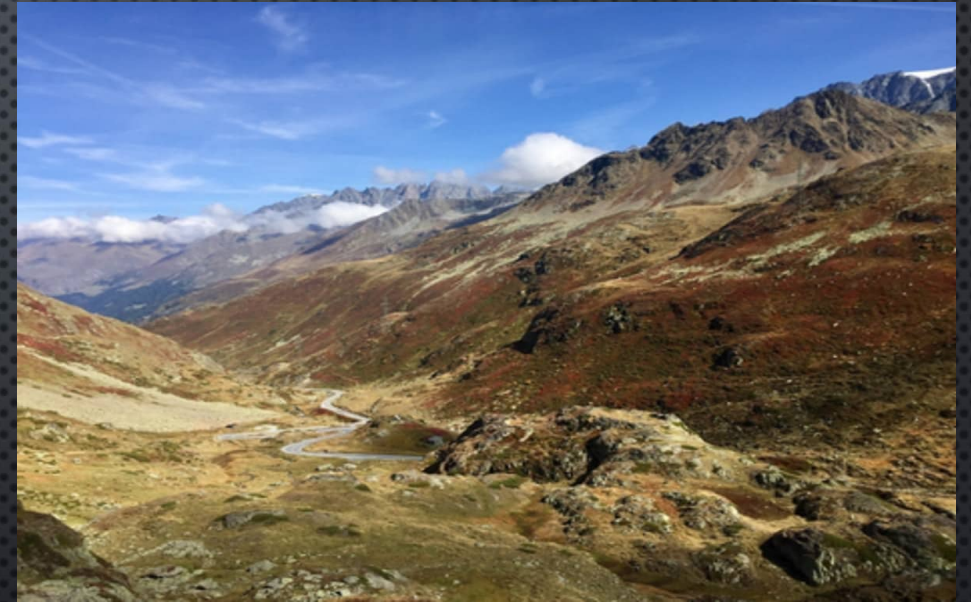
Col du Grand Saint-Bernard 2469 m

Dîner en ville pour déguster les saveurs de la vallée d'Aoste