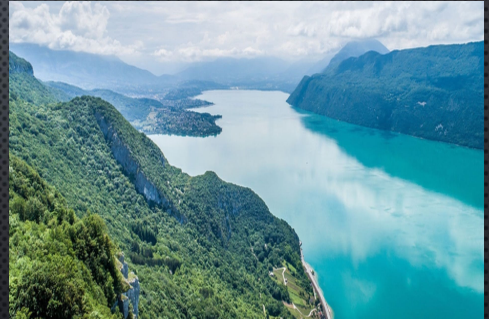
Lac du Bourget

On quitte l'Alpe d'Huez en évitant Grenoble afin de nous rendre au bord du lac du Bourget pour le lunch. Retour à Genève par les routes départementales pour une arrivée vers 17H00.