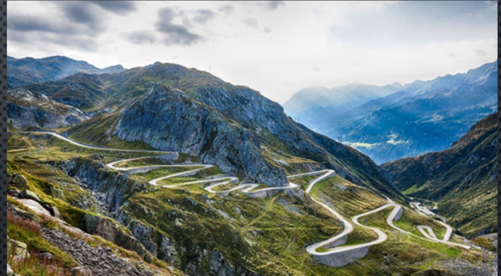
Col du Galibier 2642 m